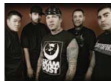
Agnostic Front, fondateurs du punk hardcore new-yorkais.