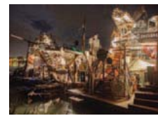
Le collectif «Le Torchon», des villages en matériel de récupération.

ria a récemment manifesté de l'intérêt pour le Palp. Peut-être cela