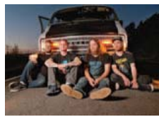
Red Fang, mythe des marges, tout droit venu d'Oregon.