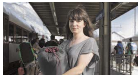
Les voyageuses et voyageurs sont aussi à l'honneur. J.-C. ROH

Voyageurs prenant la pose, employés de la compagnie, vues d'une gare à la tombée de la nuit ou d'un train arrivant près du quai, détail en gros plan ou ouverture sur un beau paysage