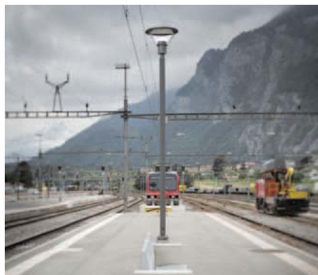
RegionAlps, à découvrir sous des angles inédits dans le livre.