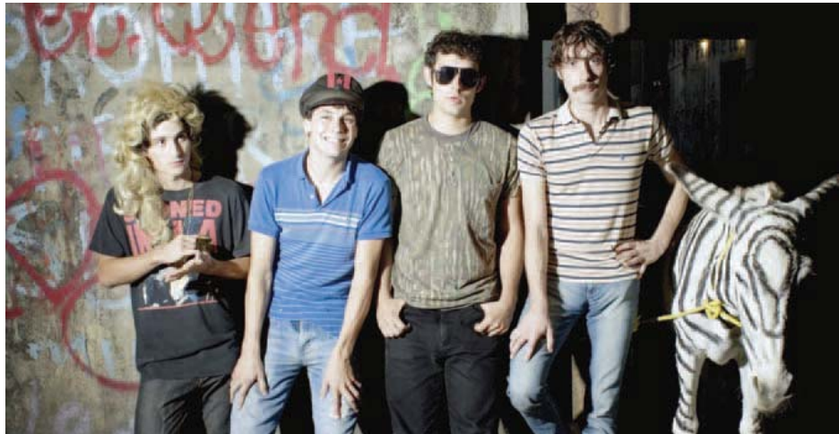
Black Lips, l'un des phénomènes du rock américain actuel, qui devrait bientôt atteindre un statut de groupe inaccessible. Cet été sera sans doute le dernier moment où le public pourra les entendre dans un cadre aussi intimiste que celui des Caves du Manoir.