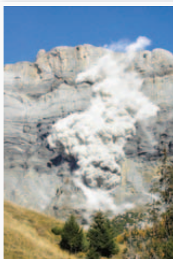
Une des photos exposées intitulée «Chaos».