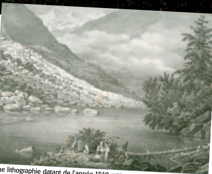
Une lithographie datant de l'année 1840.