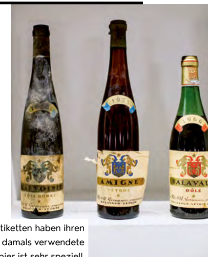
Alte Weinetiketten haben ihren Charme – auch das damals verwendete Papier ist sehr speziell.

Im Laufe des 20. Jahrhunderts haben die Auftraggeber und Gestalter von Etiketten für Walliser Weine schnell identitätsstiftende Bildelemente entwickelt, die mit dem Wallis und dem Wein verbunden sind: kraftvolle und einprägsame visuelle Elemente, die Traditionen vermittelten und – je nach Vertriebsnetz – eine schnelle Identifikation und Wiedererkennung zum Ziel hatten (die Entstehung der Supermärkte